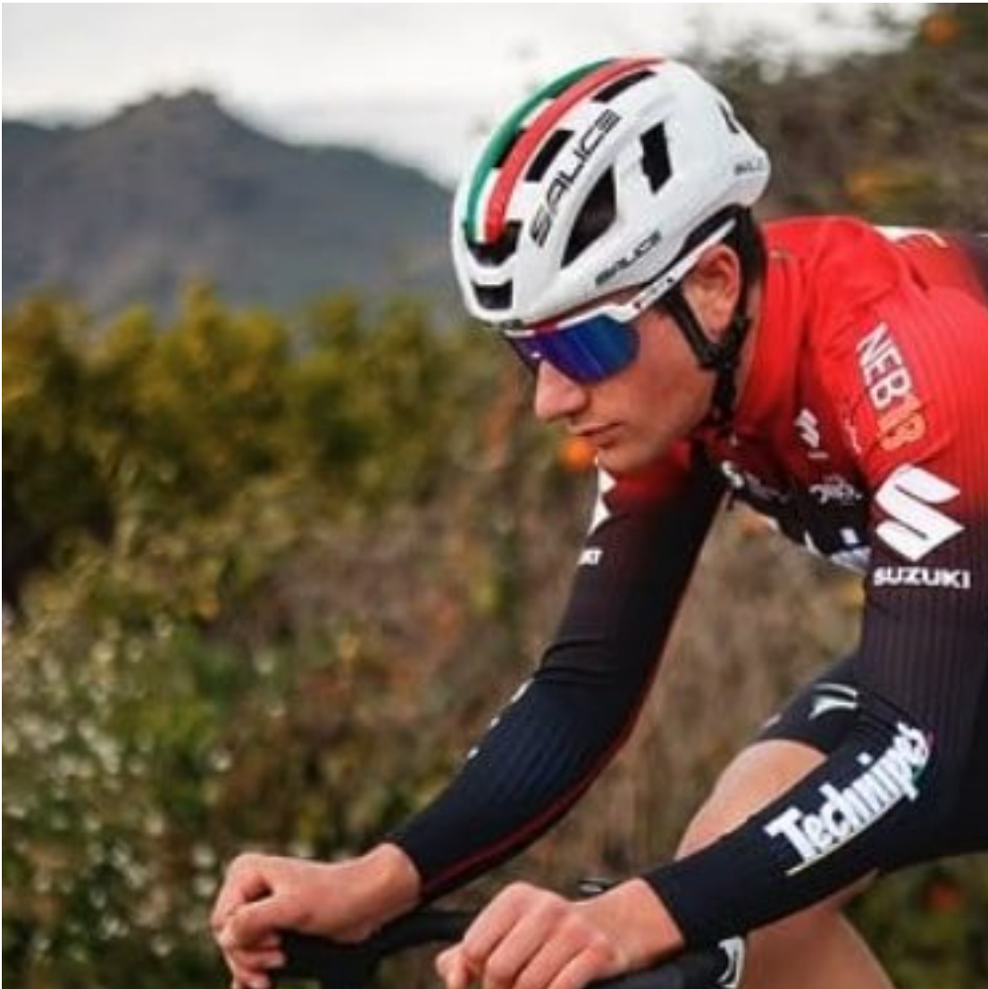
La Technipes-InEmiliaRomagna è uno dei team sponsorizzati da Salice